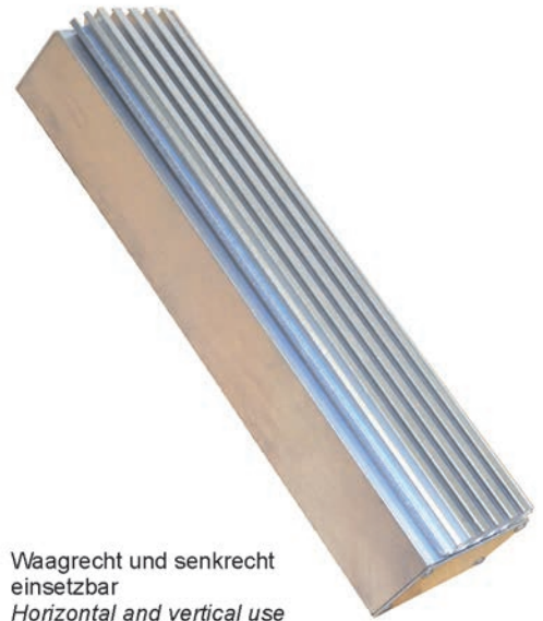
Waagrecht und senkrecht einsetzbar Horizontal and vertical use